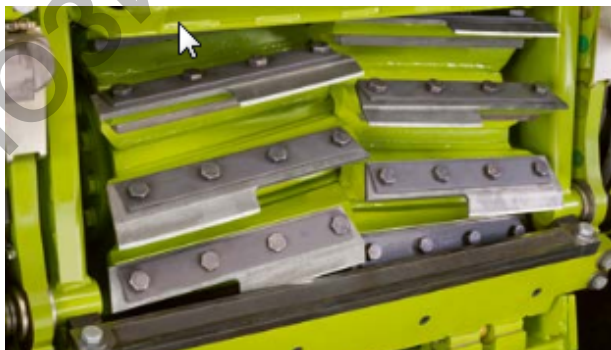
Рисунок 3 – Полуножи установленные на измельчающем барабане V20

Тем не менее изготовитель указывает на необходимость контроля за размером зазора между валцами который влияет на интенсивность дробления и измельчения обрабатываемой массы, и соответственно на расход мощности при работе машины.