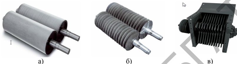
Рисунок 1 – Виды доизмельчающих устройств кормоуборочных комбайнов: а) вальцовые; б) дисковые; в) роторные

На данный момент используются три основных вида доизмельчающих устройств: вальцовые, дисковые и роторные.